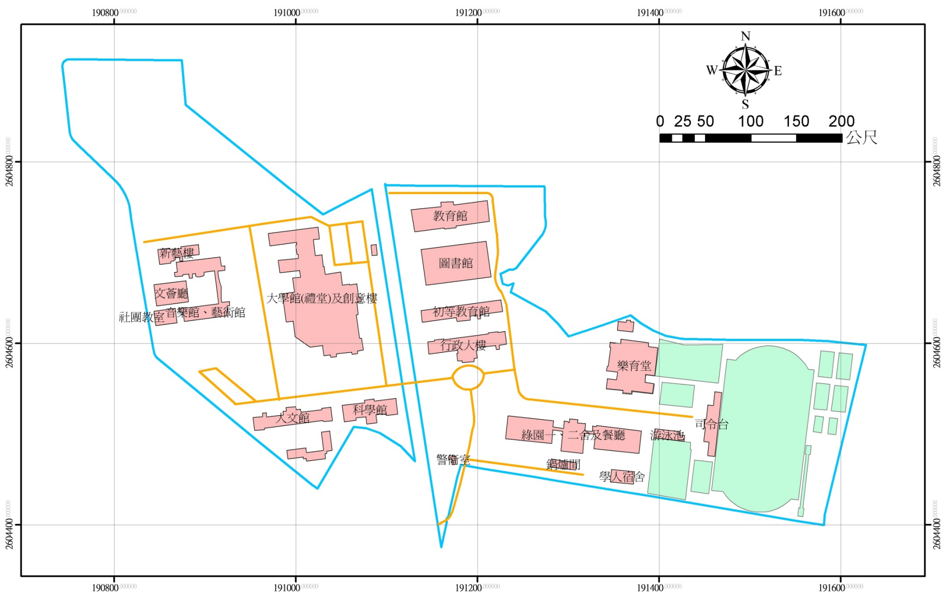
國立嘉義大學民雄校區平面圖